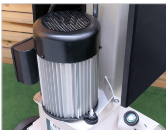
Moteur aluminium Aluminium motor