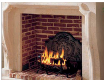
Spécial cheminée, insert Special fire place