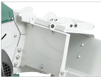
Carter de protection Safety cover