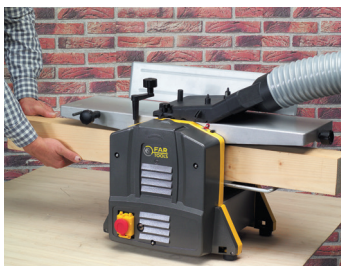
Fonction raboteuse Planer function