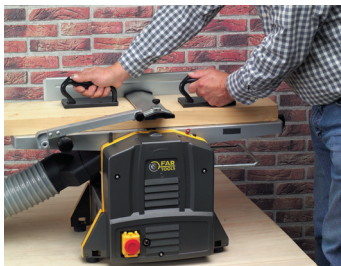
Fonction dégauchissage Thicknesser function

Livrée avec son support et 2 patins poignées de sécurité Delivered with its support and 2 security pads