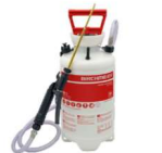
MATÉRIEL DE TRAITEMENT