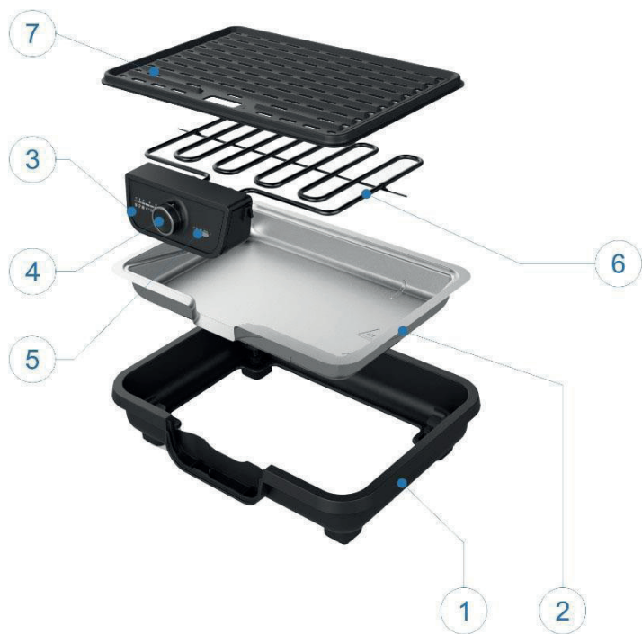
Illustration indicative pour la position du bouton de réglage (4)